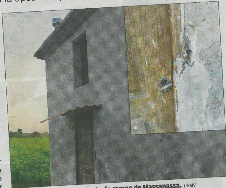
Puerta forzada en una caseta de campo de Massanassa.

■ Con la llegada del verano se suele incrementar el número de robos en domicilios particulares aprovechando la marcha vacacional de los propietarios y Massanassa no es una excepción. El pasado miércoles se denunció el robo de joyas y otros elementos de valor en una vivienda particular de la calle València, en la que se personaron una patrulla con dos agentes. Un incidente que se suma a otra denuncia sobre intentos de robo forzando furgonetas aparcadas en la calle 9 d'Octubre. También ha podido saber este diario que intentaron forzar la puerta de una caseta de campo en la marjal, lo que ha provocado que el dueño decidiera dormir alguna noche allí para evitar el robo del material de trabajo que tenía dentro.